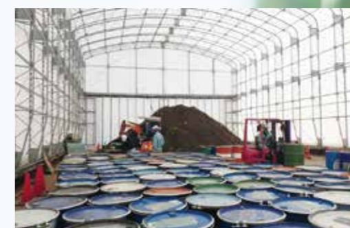
■ 環境対策工事 (埋設廃棄物・土壌汚染対策)