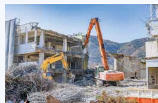
■ 構造物や設備の解体工事