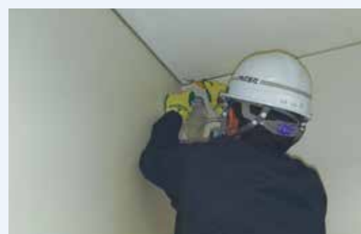
■ アスベスト・PCB等の環境調査