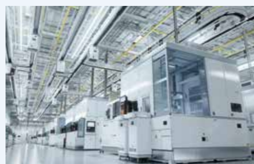
■ 中古機器・設備の買取り